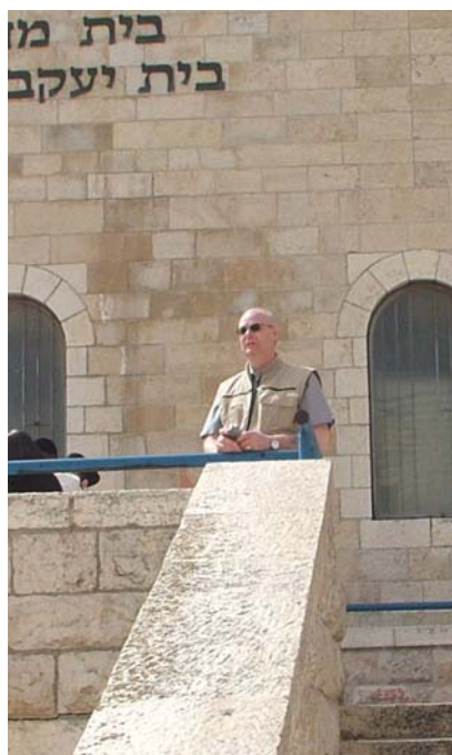
Artikkelforfatteren på trappen som leder opp fra plassen foran Vestmuren og inn i det jødiske kvarter i Gamlebyen i Jerusalem.

Vi gleder oss også over de talerne og sangere som kommer og som jeg tror at Herren vil bruke på en velsignet måte også dette året.