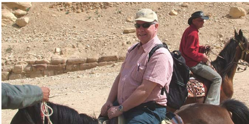
En kanskje noe uvant stilling for artikkelforfatteren. På hesteryggen på vei ned til Petra-utgravningene i Jordan.

Hamas er en terrororganisasjon som har blitt en terrorregjering og som