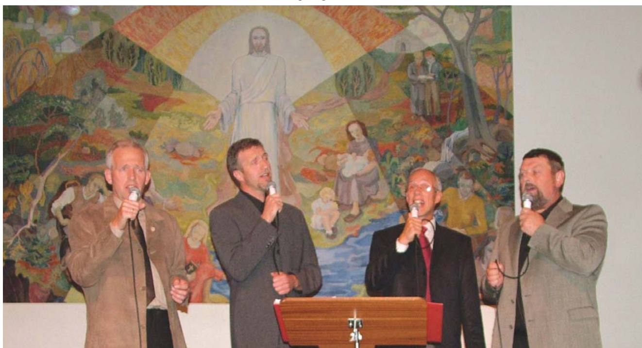
Focus Kvartett under en konsert i Trondheim.