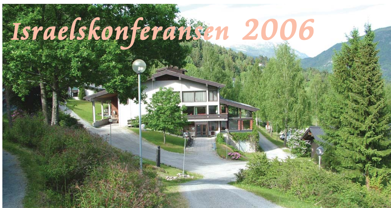
Folkehøyskolen ligger i et vakkert område, med praktfull utsikt mot Seljordvannet.