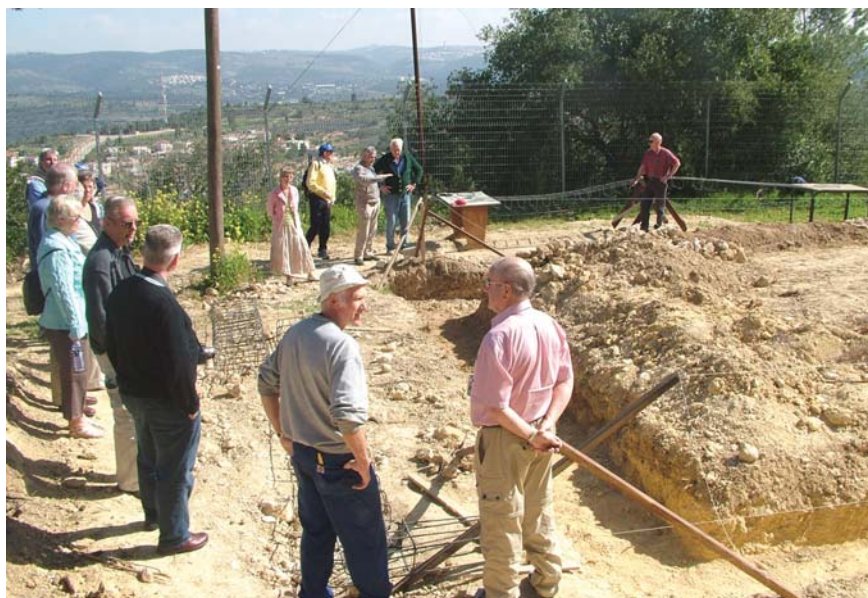
Ringmuren er utgravd og klar for støping .

betong og jernbinder arbeid har arbeidsstaben hatt en gjennomsnitt alder på 69,6 år. Det er sprekke pensjonister som har gjort en fantastisk jobb. Så skulle du være en av dem som