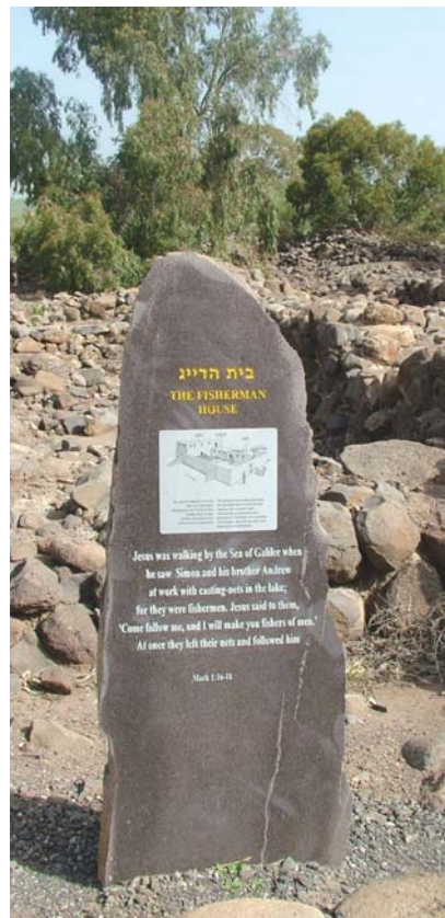
Stenen foran fiskerens hus i utgravningene etter Betsaida, byen hvor Peter og Andreas var fra.

Hoffmannen hadde av en egen fri vilje valgt å tro på skriftene i GT. Han hadde valgt å dra til Jerusalem, kanskje i håp på å få svar på en del spørsmål som var ubesvart.